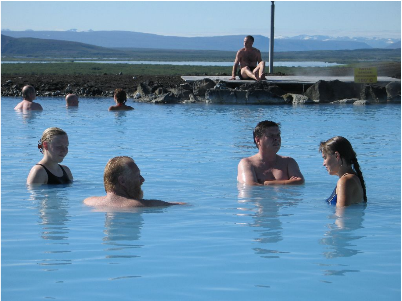
Torstain aikana ehdittiin tutustua Namafjallin geotermiseen alueeseen sekä uida kuumassa lähteessä.

ryhmien töitä esittelykuntoon. Keskiyöllä päästiin yöpymispaikkoihin: me naiset ihastuttavalle maatilamatkailutilalle keskellä avaraa laaksoa ja miehet hotelliin läheiseen kaupunkiin. Maatilan maisemat ja muutama yksityiskohta peittosivat hotellin: sen lasilla katetulla verannalla kasvoi niin omenapuu kuin viiniköynnösikin!