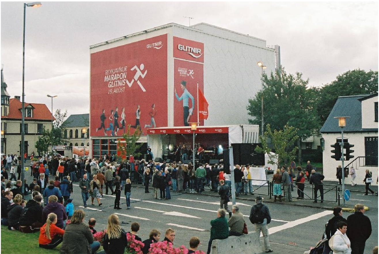
Lauantai-illan Reykjavíkissa kruunasi Kulturnatt eli paikallinen Taiteiden yö.

miehistöä. Lautalla todettiin, että miehistö oli vaihtunut eikä uusi tiennyt asiasta mitään. Pari ryhmää oli silti pitänyt kiinni ajatuksestaan dokumentoida laivan miehistön tiloja ja työtä. Lopputulos on arvattavissa. Oma ryhmäni sai aikaan raflaavan otsikon: Mayday – det händer inte mej! eli tarkastelimme laivalla eri roolissa olevien ihmisten strategioita arvioida ja hallita matkustamiseen liittyviä riskejä. Seminaarista on tarkoitus koota raportti, joka julkaistaan Norsamin nettisivuilla.