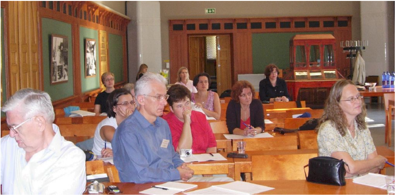
Symposiumin osallistujia esitystä kuuntelemassa.

seen osallistumismaksukäytäntöön. Toisena Suomen Akatemiankin esittämänä vaateena on lisääntyvä avoimuus, mikä tarkoittaa symposiumiin osallistumismahdollisuutta myös muille kuin unkarilaisille ja suomalaisille.