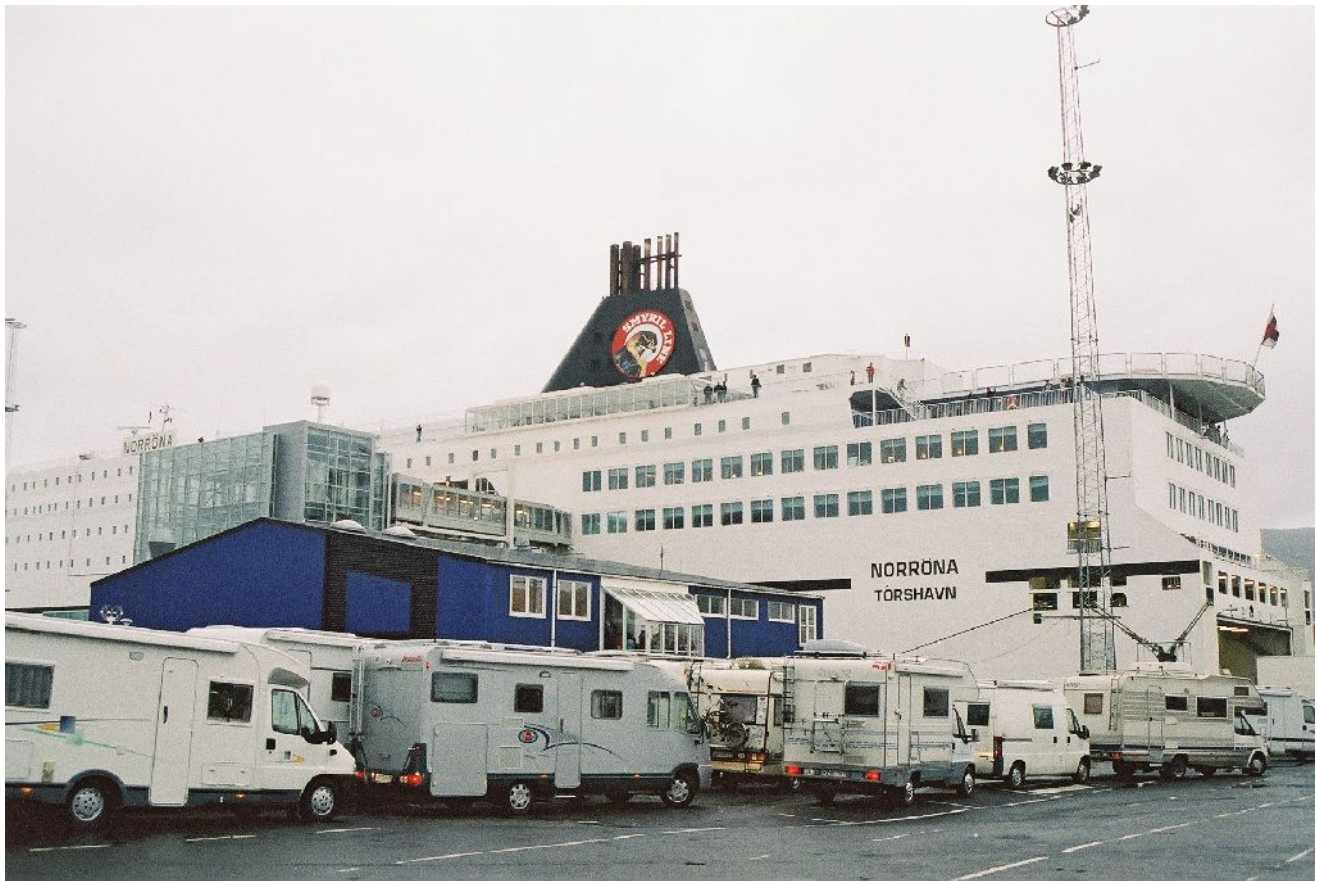
Seminaarin pitopaikaksi oli valittu Smyril Linen matkustaja-autolautta Norröna, joka purjehtii Bergenistä Färsaarten kautta Islantiin. Valok. Pirkko Madetoja 2006.

tiprojektiksi museonäkökulmasta ja tehdä pieni kenttätyö. Työtä oli pohjustettu kevästä asti alustavalla aiheen valinnalla ja problematisoinnilla sähköpostitse.