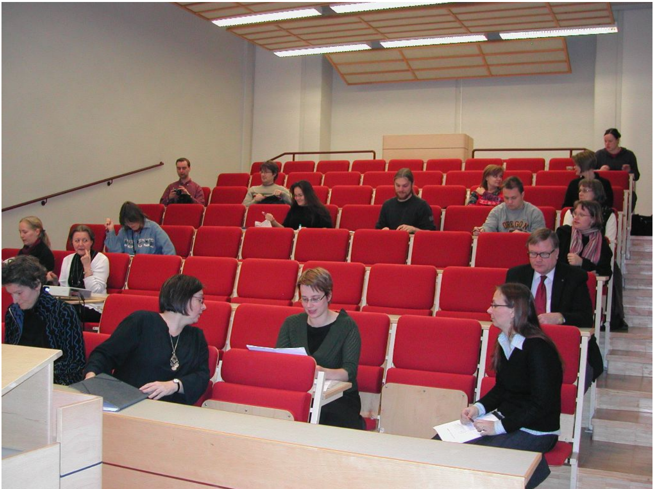
Sali täyttymässä. Esitelmöitsijät etualalla.